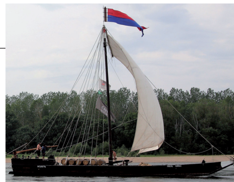
La gabare Pascal-Carole sous voile

Nous participations au Festival de Loire